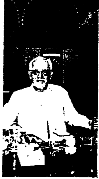
الرئيس فرنجية جالساً وراء مكتبه خلال الندوة الصحافية هذا الواقع - وارثاً غريباً - يطولون منا العفو عما مضى ، ولا يغفون عن المسبب لا مضى .